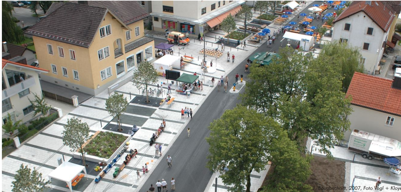
Eröffnungsteil 1. Bauabschnitt, 2007