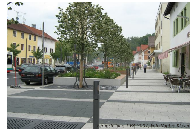
Fertigstellung 1. BA 2007

Entwurfsplanung: Neugestaltung der Innenstadt Penzberg