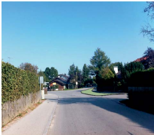
oben: Fotomontage zum Gestaltungsvorschlag Großdingharting unten: Gestaltungsvorschlag und Schleppkurvenüberprüfung Großdingharting