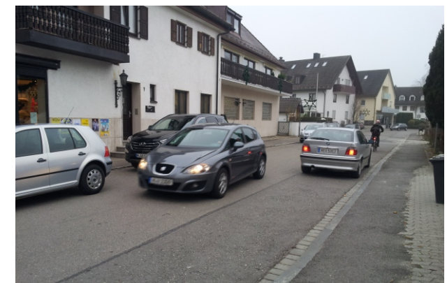
Aktueller Zustand (2015)

Auftraggeber: Stadt Ismaning Bearbeitungszeitraum: 2015