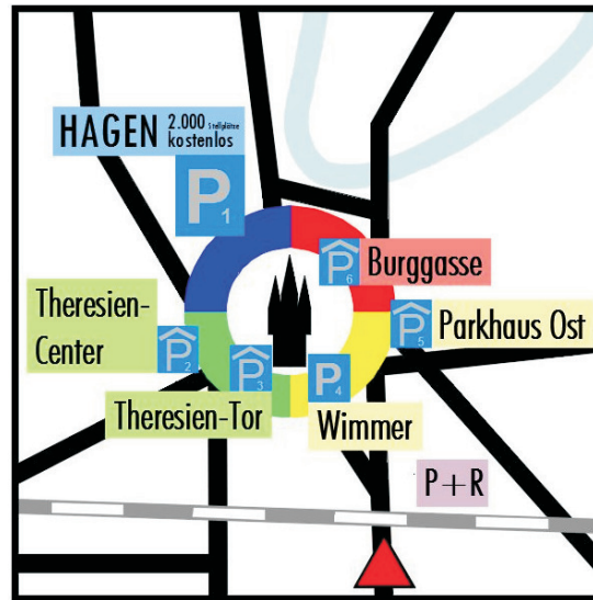
Entwurfsvorschlag Vorwegweiser für das Parkleitsystem der Innenstadt