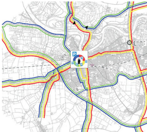
Vorschlag zur Führung der Routen zu den ausgewiesenen Parkplätzen entlang der Hauptzufahrtsstraßen