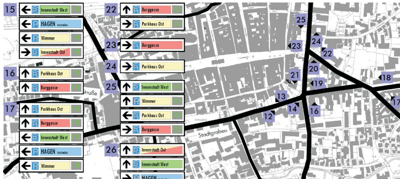
Lösungsansatz für die Gestaltung und Positionierung der Hinweisschilder (Ausschnitt)