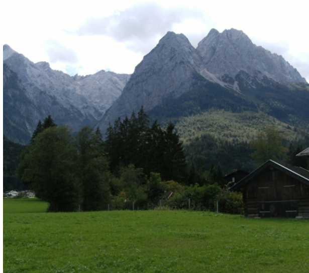
Lage des Campingplatzes auf der Hochebene