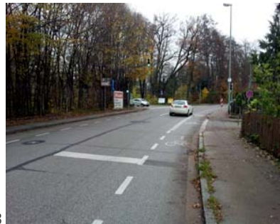
Gautinger Straße 2013